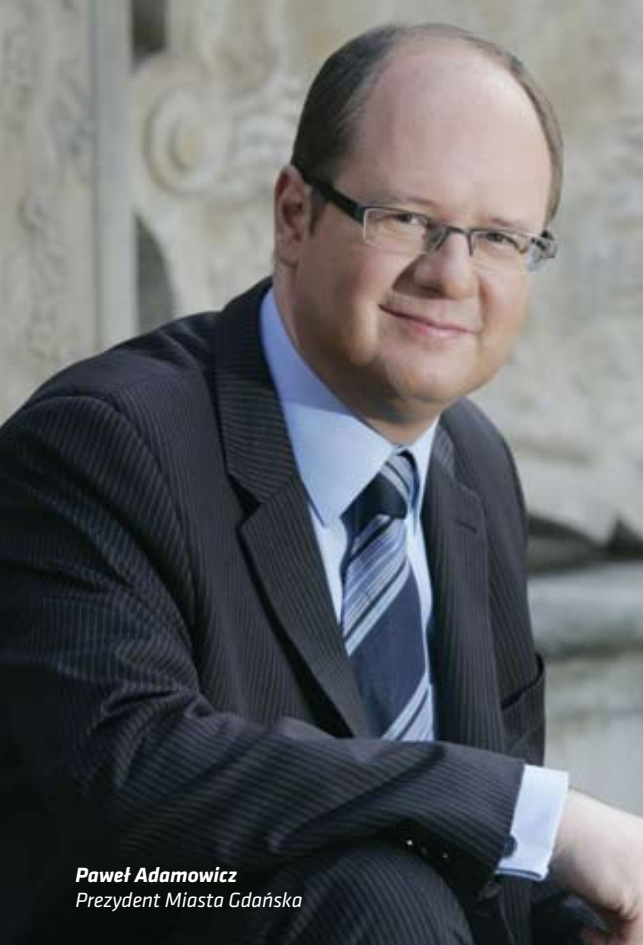
Paweł Adamowicz Prezydent Miasta Gdańska