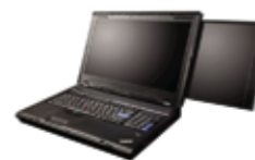
ThinkPad Seria W