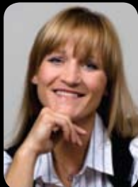
Iwona Guzowska, Poseł na Sejm RP Wielokrotna mistrzyni Polski i Europy w kick-boxingu, mistrzyni Świata i Europy w boksie zawodowym.