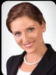
Joanna Mucha, Minister Sportu i Turystyki