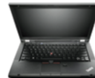
ThinkPad Seria T