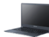
ThinkPad Seria X

W celu świadczenia usług na najwyższym poziomie, w ramach naszego serwisu stosujemy pliki cookies. Korzystanie z witryny bez zmiany ustawień dotyczących cookies oznacza, że będą one zamieszczone w Państwa urządzeniu końcowym. Jeśli nie wyrażają Państwo zgody, uprzejmie prosimy o dokonanie stosownych zmian w ustawieniach przeglądarki internetowej.