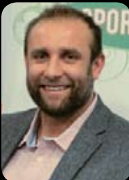
Artur Siódmiak, piłkarz ręczny, reprezentant Polski, brązowy medalista i wicemistrz świata